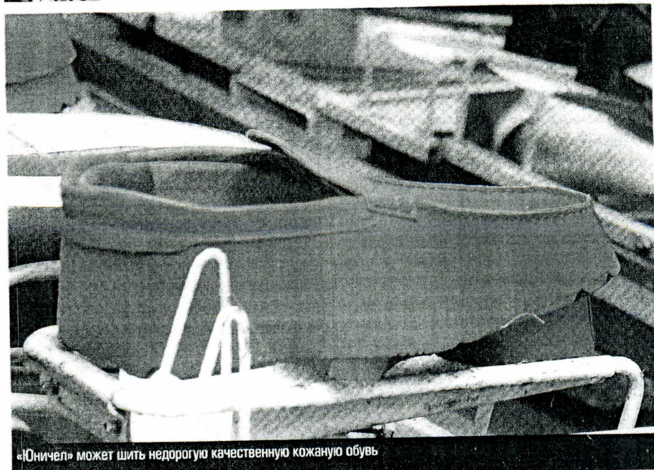
«Юничел» может шить недорогую качественную кожаную обувь

Лишь бы поддержать производство, сделать оборот. Не снизим цены — купят на 30 — 40% меньше и производство остановится.